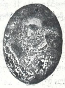
ა. აუყურელი, ევკლდაშვილისა, ა. იმედაშვილი