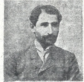
ბ. ასოსავალი (გაბუარიამ) მგოსანი და ნამამადარი ზოკარანხე.

Handwritten signature or note at the bottom of the page.