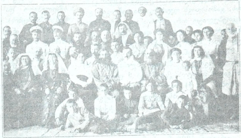
სოფ. ხაშმის სასწავლებლის კურსი 1912 წ. 8 ენკენისთვის მასწავლებელნი, ლედილობრივა საზოგადოების წარმომადგენელნი და მასწავლებელი გარეშენი.

1902 წ. ს. ხაშმის საზოგადოებამ შეაკეთა ნაწილი პურის მალაზიის შენობისა, რომელიც ჰქონდა მთავრობისგან ნაყიდი შეკეთება შენობისა დაუჯდა საზოგადოებას 1800 მ. მთავრობა დაეხმარა — 700 მ-ით. შეკეთებული შენობა