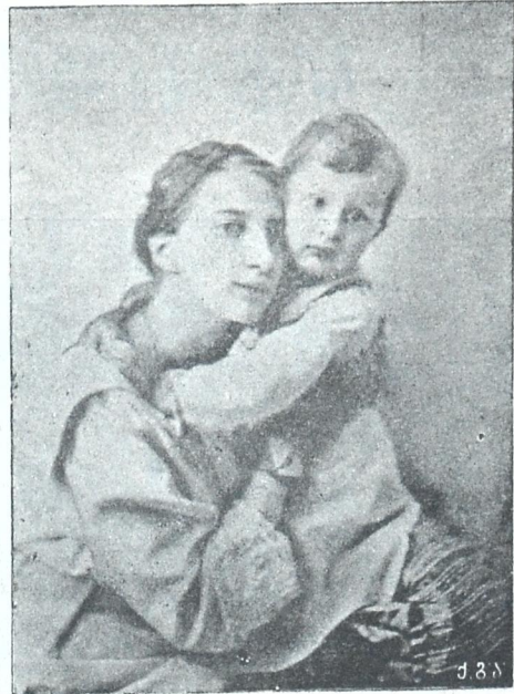
მ. უ. ტატინა კონსტანტინეს ასული

გამუდმებულმა ბრძოლაში ბუნებით გულჩვილი და შემბრალებული ქართველი ომის უამრავ შუებრძალებად გადაქცევა... ასეთი იყო თვით სეზვა, რომელიც ღუხუშის წინაშე მოიგონებს ერთ შესანიშნავ შემთხვევას თავისი ცხოვრებადამ, როდესაც სოფლის საბუის ბოლოში სამშობლოს ერთსმტკერს თავის ხმლით მოწვევით თავი... ვისდა ეტაცა სიბრძნეულისთვის, როდესაც ქართველის კარშია დასმული იყო ეოფნის და ანუოფნის საკითხი... ვაჟა-ფშაველას ამართლებს ასეთს ხასიათის გაკავებას, ვინაიდან ის გამოწვეული იყო კანონიერი თავდაცვის აღდოს მიერ და გამოჰქვდა რკინისავით მაგარი ისტორიული აუცილებლობის მიერ... საერთო გაჭირვების უამრავ თითოეული ადამიანის