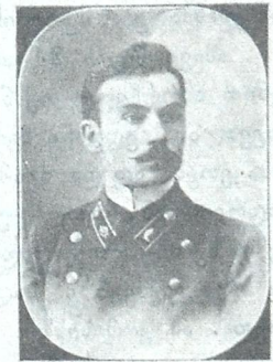
ალ. ესტ. მოზდოკელი მასწავლებელი და ზედამხედველი სასწავლებლის, თავჯდომარე სკოლის ამჟამინდელ კომისიისა. უმთავრესად მისი მეცადინეობით აშენდა სკოლა.

1907 წ. ნოემბრის 5-ს დღესა სოფ ხაშმის საზოგადოებამ მამასახლისის ი. ი. შვილის წინადადებით, დაადგინა გა-