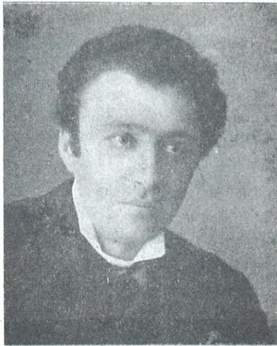
ცნობილი სკანდინავიელი მწერალი (ბასი)