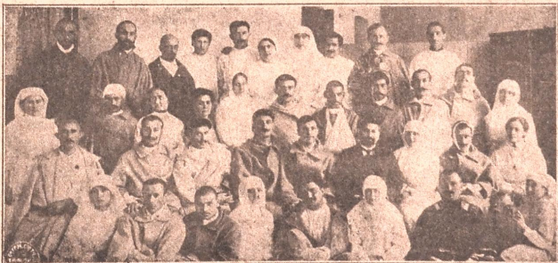
დავრ. ქართველ. მეომარნი და მათი მომვლენი წმ. ნინოს ლაზარეთში