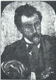
მეოსანი ო. ოლესი

ოლესი უკრაინელი ხალხისა და მგოსნიისა და წარმტარს ათარდს: ძალიან უკრაინულს ნორის ზოცისას.