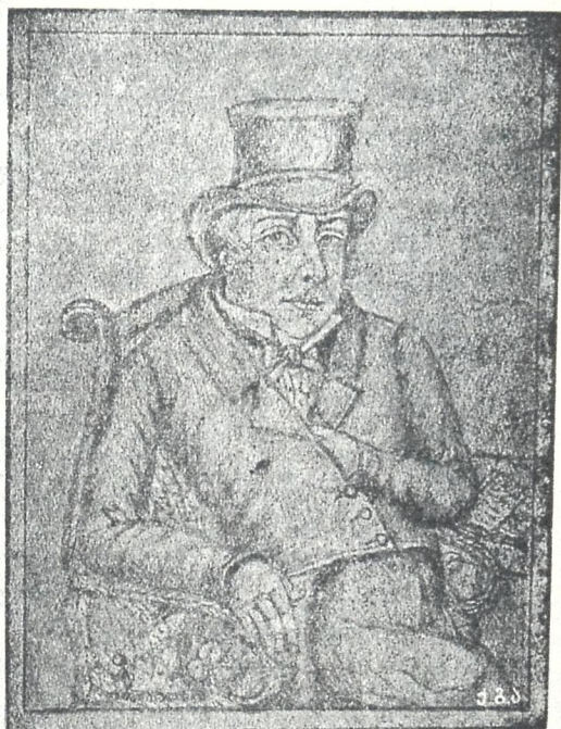
სოლომონ დოდაშვილი (1799—1836)

— ქართველთა შორის მამულიშვილობის იდეის გამგრძელებელი მეცნიარეტი საუკუნის დასაწყისში. საქართველოს რუსეთთან შეერთების შემდეგ პირველი ეს წავიდა რუსეთს უმაღლესი განათლებისთვის, დაასრულა პეტროგრადის უნივერსიტეტი. 1828 წ. თბილისში გამოსცა ქართული გაზეთი და ჟურნალი, გახსნა სკოლა და სტამბა, შეადგინა იმ დროის სასულ. სემინარიის და კეთილშობილთა სასწავლებლის პრეტორიის შესაფერი ევკლა საგნის სახელმძღვანელოები, რუსულად დასწერა „დიხერტაია“ მკლე ლოდიკა (პეტროგრადში გამოიცა). 1832 წ. ირკუტსკის გუბერნიისში გადასახლდა, სადაც გადმოიცა 1836 წ. (სურათი ამოღებულია ზ. ჭიჭინაძის „ქართული სტამბის ისტორიიდან“).