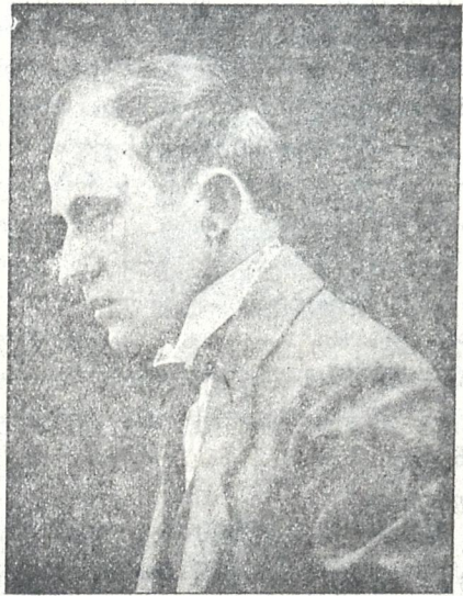
მსახიობი ვ. არაბიძე