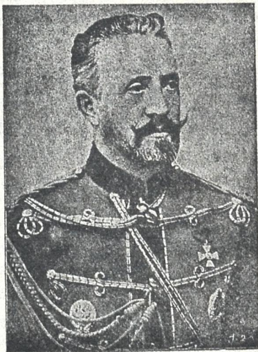
მ. ი. უ. ნიკოლოზ ნიკოლოზის-კმ მეფის ნაცვალი და კავკასიის ჯართა მთავარსარდალი, თბილისის ჩამობძანდა 28 ენ კენისთვეს.

დღესაც ეს თეატრი პირნათლად ემსახუ- რება თავის მიზანს, მაგრამ ვინ არ იცის,