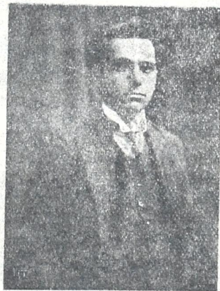
† გ. არადელი-მშენელი