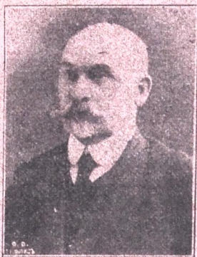
თავმჯდომარე მ. ვ. მაჩაბელი