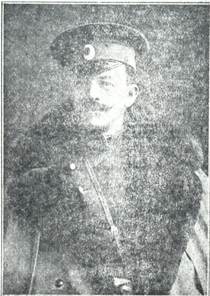
აკოლკ. თაგ. ნ. მ. ზავეზაშაძე გმირობისათვის ოქროს ხმლით და სხ. დაჯილდოვ.