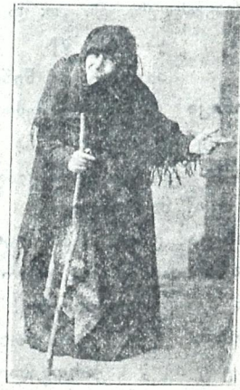
მათალა (60 წ. „ჩარშიეი“) ფროშარი (ორი ობოლი) ხორეშანი (60 წ. „ჩარშიეი“